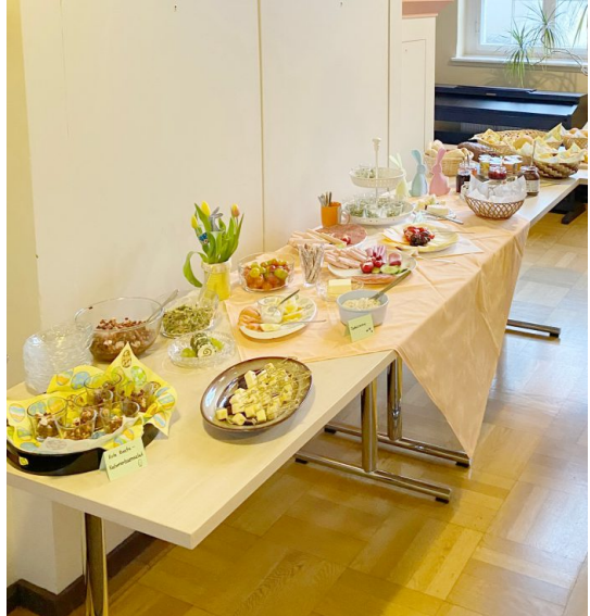
Osterfrühstück 2023 – Das Buffet.

Am Ostermontag, 01. April, um 11 Uhr feiern wir einen Gottesdienst für Klein und Groß – diesmal in der Lutherkirche . Auch hier darf das gemeinsame Ostereiersuchen im Anschluss natürlich nicht fehlen... Herzliche Einladung!